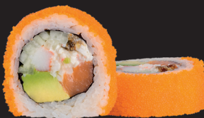
LENNON ROLL $ 17 90