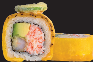
MONKEY ROLL $ 15 90