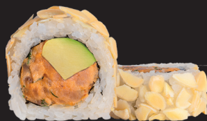
SPICY ALMOND ROLL $ 15 90