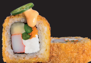
QUEEN ROLL $ 16 90