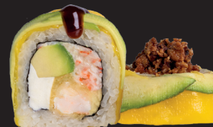
SUNSET ROLL $ 17 90