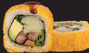
MANCHEGO ROLL $ 16 90