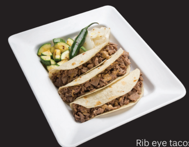
Rib eye tacos