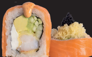
SAMURAI ROLL $ 15 90