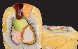
APPLE ROLL $ 16 90