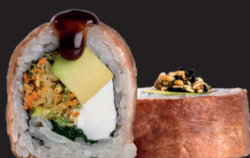
GYO ROLL $ 16 90