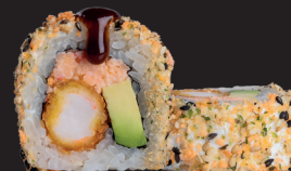
SANJE ROLL $ 16 90