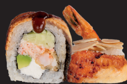
ALMOND ROLL $ 17 90