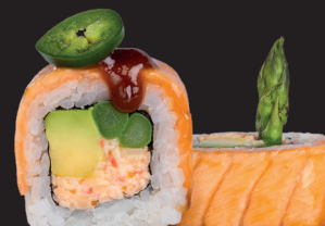
SALMON BBQ $ 17 90