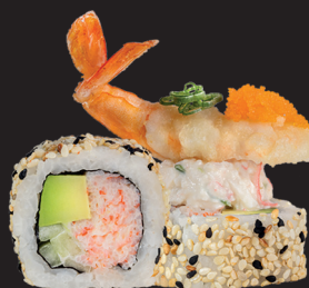
TIC TOC ROLL $ 17 90