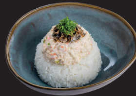
Gohan Tampico Especial

Piel de salmón, tampico, ajonjolí y un toque de cebollín.