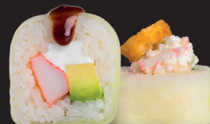
INN ROLL $ 17 90