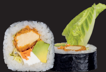
TOTTORI ROLL $ 15 90