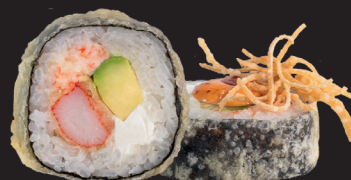
KANI CRUNCH ROLL $ 15 90