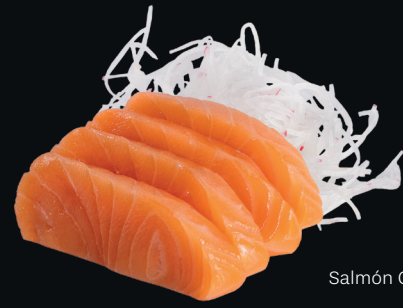
Salmón Corte Grueso