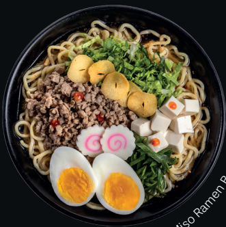
Spicy Miso Ramen Beef Grande