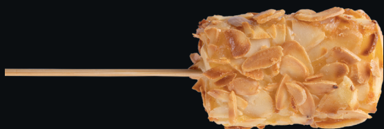
Kushiage manchego + almendra