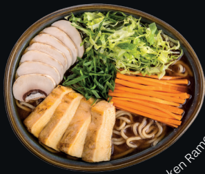
Chicken Ramen Chirico