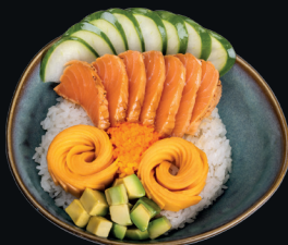
Poke Bowl Salmon Teriyaki